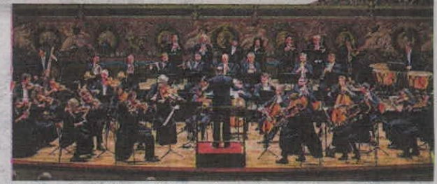
La Orquesta del Festival de Dresden será una de las grandes invitadas al IV Festival Internacional de Música Clásica en Bogotá.

Bogotá, Teatro Colsubsidio Roberto Arias Pérez, Teatro Estudio Julio Mario Santo Domingo, Teatro Mayor Julio Mario Santo Domingo y Teatro Villa Mayor. Consulte la programación en www.teatromayor.org y en www.boyaca7dias.com