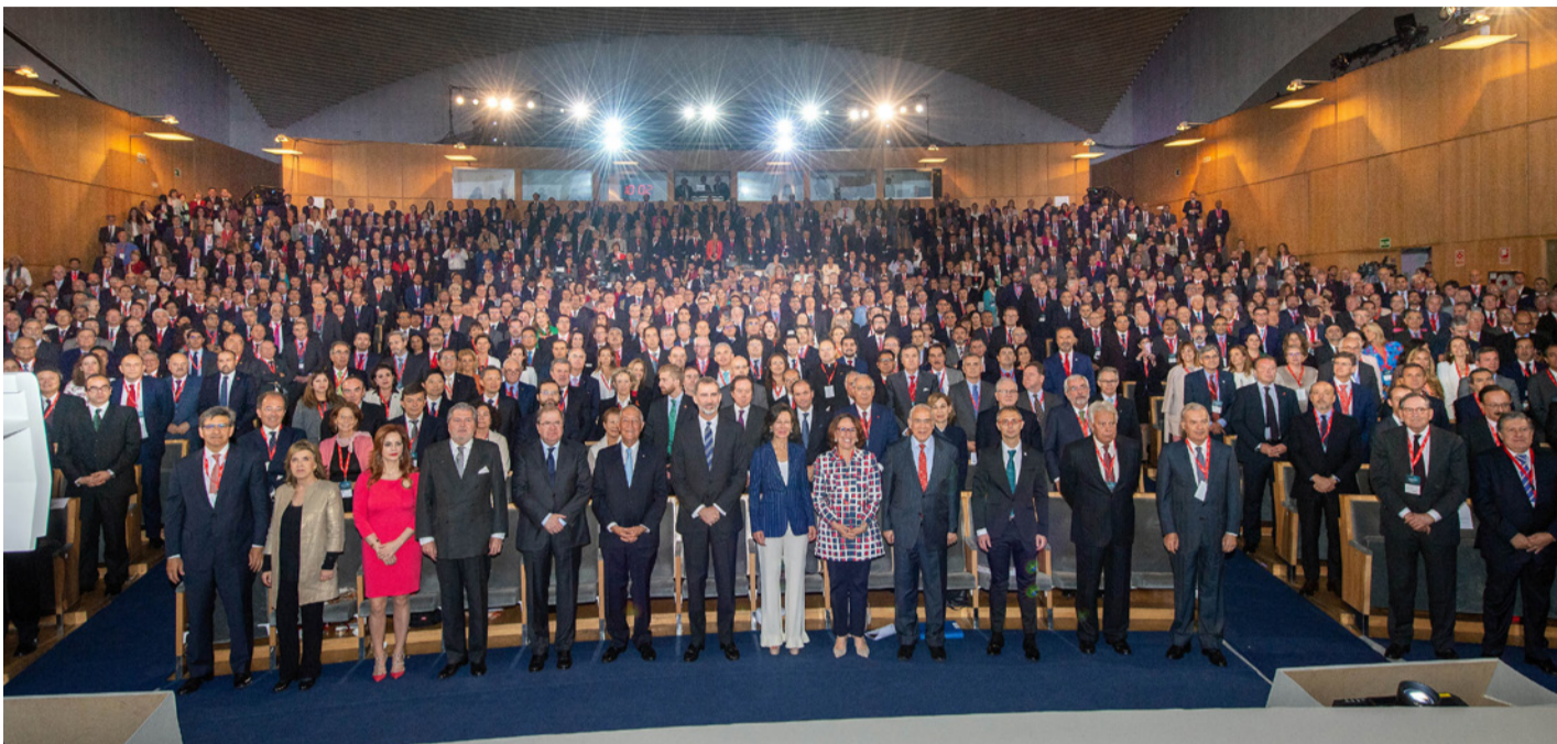
Asistentes durante el acto inaugural del IV Encuentro Internacional de Rectores Universia 2018

Los debates mantenidos sobre la contribución de las universidades al desarrollo social y territorial ponen de manifiesto la existencia de profundas desigualdades en nuestras sociedades. Las universidades reflejan estas desigualdades y no pueden eliminarlas por sí solas, pero sí pueden y deben ser una parte importante para su solución, siendo ejemplos de equidad y diversidad , y actuando como agentes transformadores del sistema económico y social.