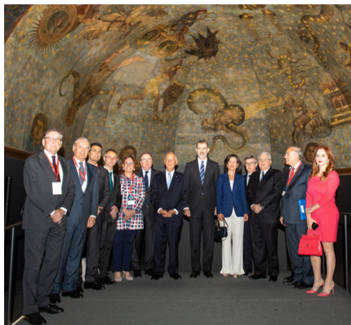
La Presidenta Ana Botín visita el Cielo de Salamanca con el Rey de España, Felipe VI, y el Presidente de la República de Portugal, Marcelo Rebelo de Sousa, entre otros