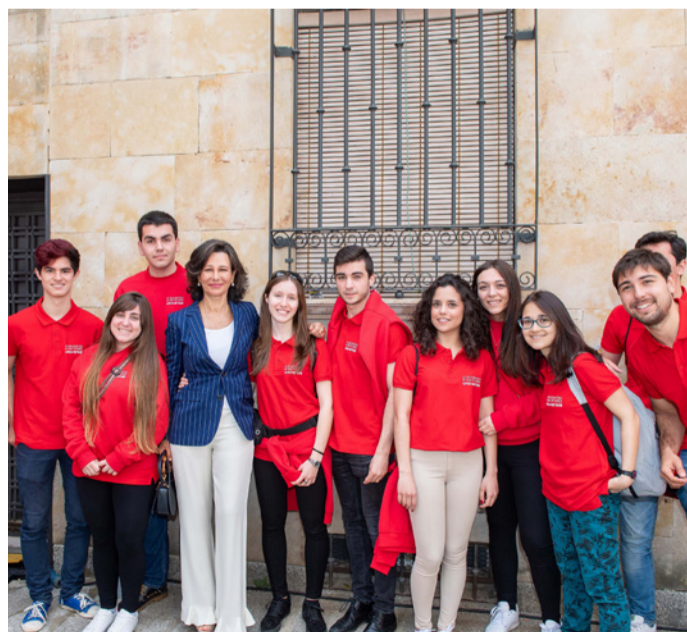
Ana Botín acompañada de los voluntarios del IV Encuentro Internacional de Rectores Universia 2018