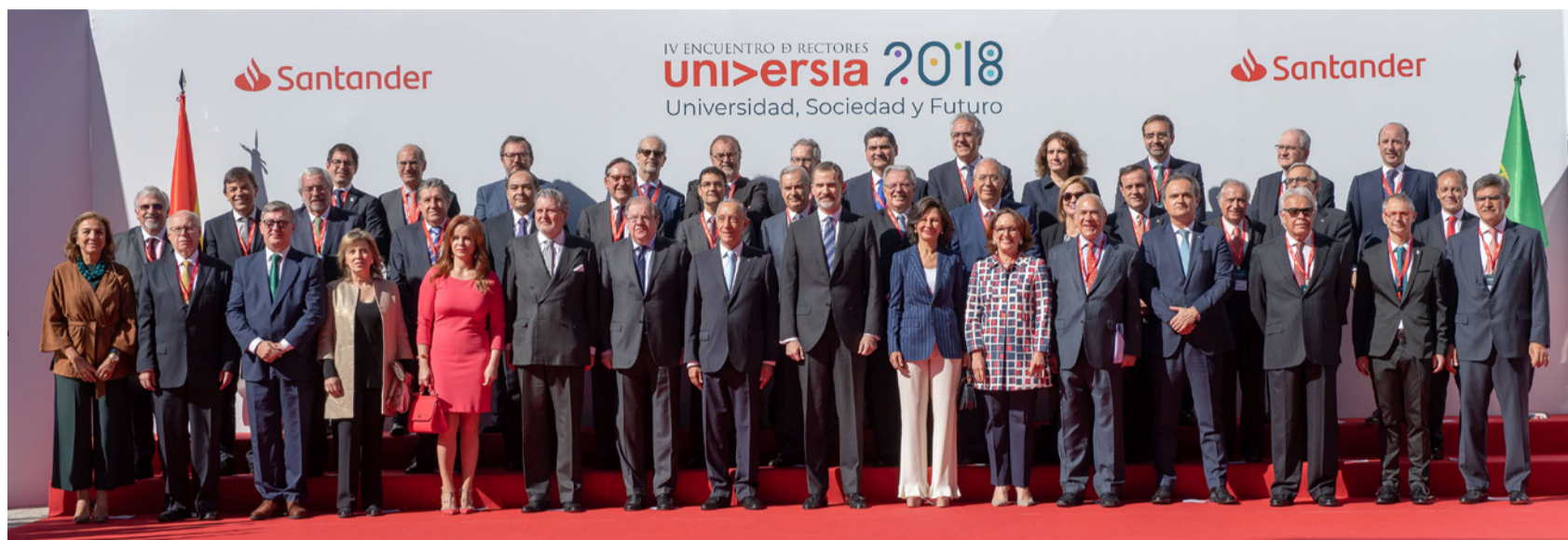
Foto de familia del acto inaugural del IV Encuentro Internacional de Rectores Universia 2018

El IV Encuentro Internacional de Rectores Universia , celebrado los días 21 y 22 de mayo de 2018 en Salamanca en el VIII centenario de su Universidad y con el lema “Universidad, Sociedad y Futuro”, ha permitido a más de 700 rectores y representantes académicos de 26 países reflexionar juntos sobre la Universidad del siglo XXI en un momento de profundo cambio y su papel clave en el desarrollo social.