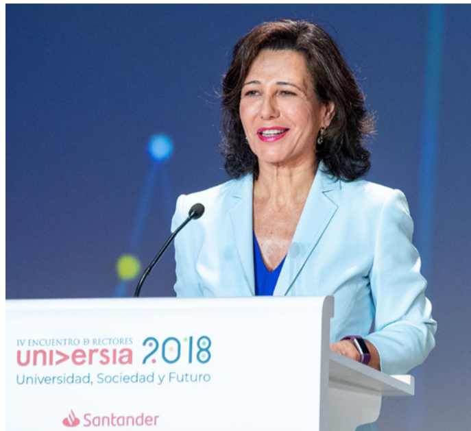
Ana Botín, Presidenta de Universia y Banco Santander

Los debates surgidos en Salamanca 2018 apuntan algunas acciones y programas especialmente relevantes para las universidades, tales como: flexibilizar y aplicar métodos educativos innovadores y repensar los procesos organizativos, administrativos y de sostenibilidad; alianzas, cursos y certificaciones con empresas de diferentes industrias; nuevos y alternativos modelos de certificación e integración con plataformas globales; ofertas formativas híbridas y programas de capacitación y actualización en el lugar de trabajo, en el marco de una formación adaptada a las necesidades del estudiante y que se extiende a lo largo de la vida; nuevas titulaciones, en especial aquellas relacionadas con las ciencias computacionales, la inteligencia artificial, la ciencia de datos y la tecnología; y un mayor énfasis en la educación humanística, así como en las competencias transversales de los estudiantes.