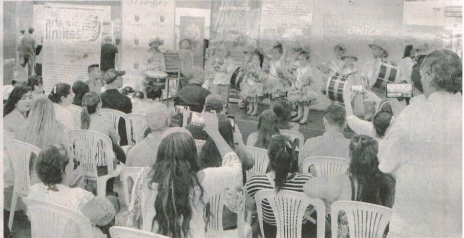
GRAN asistencia en la presentación de los Reyes del Carnaval 2020..