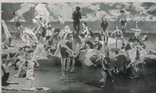
LA compañía de danza contemporánea El Colegio del Cuerpo estará en la ciudad para compartir su experiencia con bailarines.

Entre la programación que tendrá la compañía se destacan 16 talleres de formación en danza contemporánea, a partir del texto literario 'El camino hambriento', del escritor nigeriano