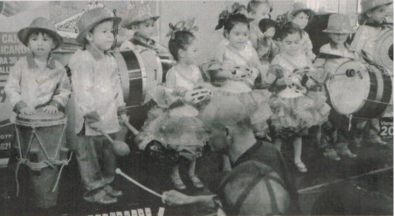
GRUPO infantil "Mi edad Feliz", durante su presentación.