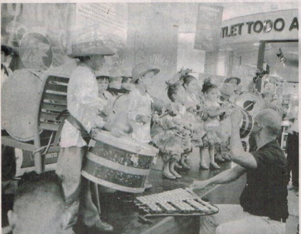
LOS niños amenizaron el evento con música folclórica.