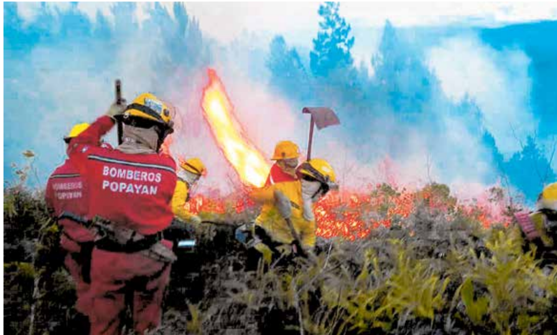
Sobre el origen de los incendios, al margen de los factores climáticos se ha detectado que existen personas que los causan, situación descrita como complicada.

Según el comandante de Bomberos Popayán, en 2018, el total de incendios fue de 254 y hasta lo corrido de 2019 van 180.