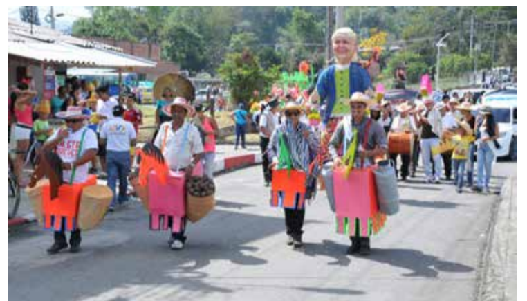
Este diplomado busca afianzar conocimientos, estrategias y metodologías para resignificar el rol de la gestión cultural en los contextos territoriales.

El diplomado tiene una duración de 110 horas en modalidad semipresencial: 72 horas