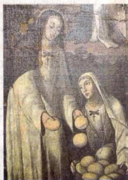
Las obras pertenecen a una colección privada. Laura Vega / Ubatón

En las casas santafereñas de la época se encuentran una gran cantidad de imágenes de grandes dimensiones, a tal punto que