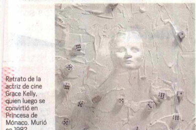
Retrato de la actriz de cine Grace Kelly, quien luego se convirtió en Princesa de Mónaco. Murió en 1982.

La obra de Grace Kelly, cuyo rostro está rodeado de