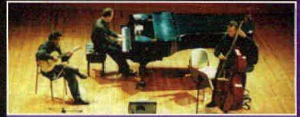
TRÍO NUEVA COLOMBIA

Trío conformado por bandola, tiple y guitarra, especializado en música instrumental andina colombiana. Ha sido ganador de varios reconocimientos, entre ellos el primer premio del Festival de Música Andina Colombiana .