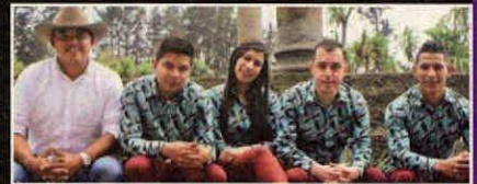
ONDA NUEVA LLANERA

Ya es un viejo conocido de este espacio musical. Desde 1988, el grupo bogotano ha participado en diversos certámenes del Festival con gran éxito. Se destaca por sus delicados toques de piano, tiple y contrabajo; un formato llamativo en la música andina colombiana.