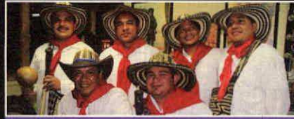
SAN JACINTO 4G

Es la cuarta generación de la reconocida agrupación Los Gaiteros de San Jacinto . Trae un show de cumbia con raíces indígenas y de los pueblos del país, mezclando con ritmos más contemporáneos como el jazz , soul y música electrónica.