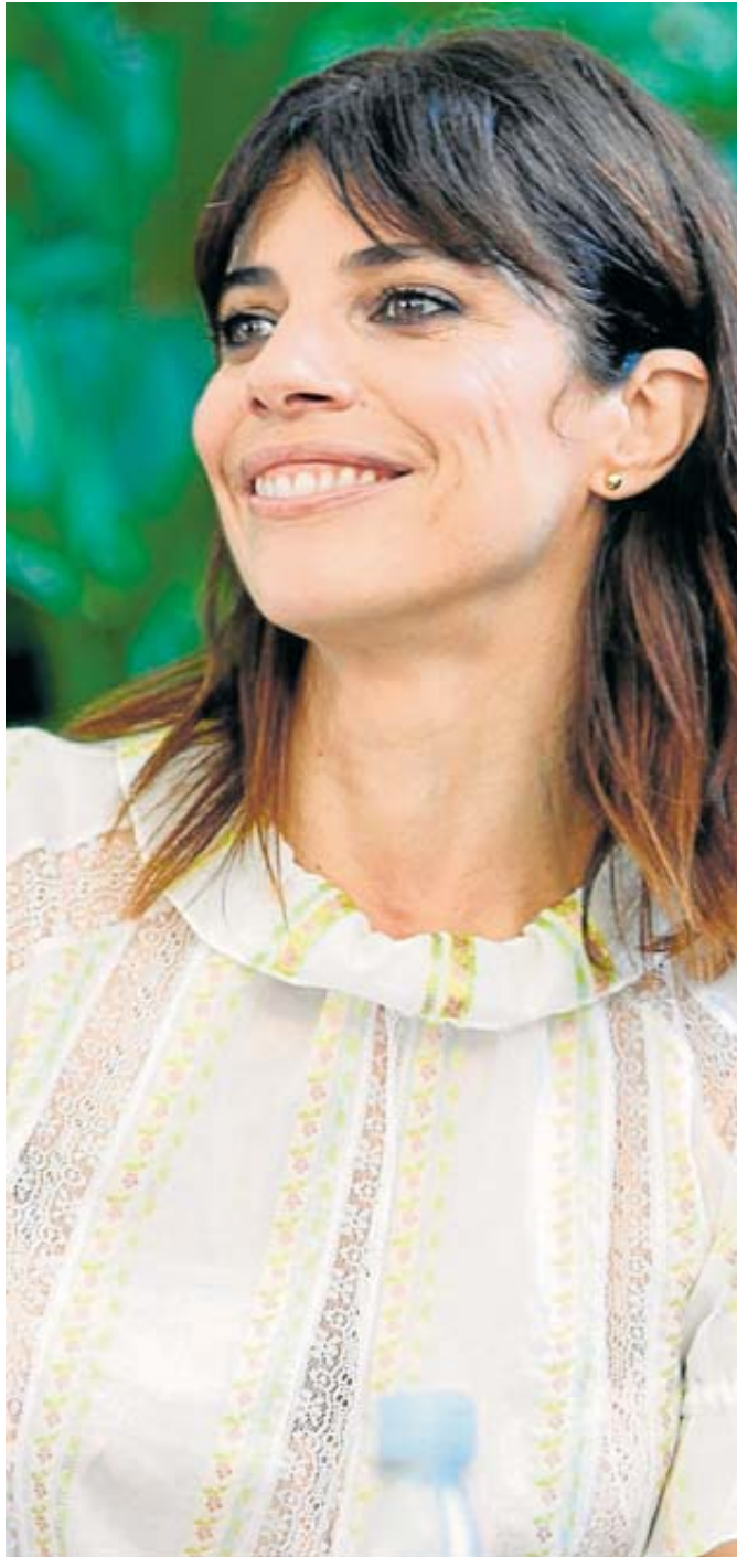
La actriz española Maribel Verdú, 2 Premios Goya, recordada por su papel magistral en 'El laberinto del fauno' y 'Tu mamá también', abre la versión 15 de Hay Festival Cartagena.

Maribel es Premio Nacional de Cinematografía y Medalla de Oro de la Academia.