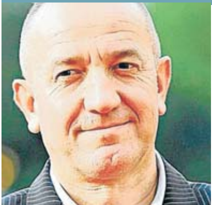
PHILIPPE CLAUDEL, A LAS 6 P. M., EN TEATRO ADOLFO MEJÍA.