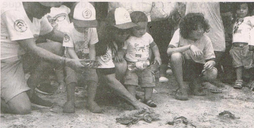
Las tortugas fueron liberadas en su hábitat natural, con el fin de evitar que sigan en peligro de extinción.

Con el apoyo de empresas interesadas en contribuir con la recuperación de ecosistemas y la protección de especies en peligro crítico de extinción, se han logrado conformar espacios donde se generan estrategias y compromisos para liderar programas que fortalezcan la protección y generación de vida