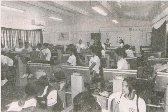
La capacitación se realizó con el objetivo de proveer elementos necesarios para posibilitar la mejor situación de elección para cada sujeto.

“Hemos querido fortalecer la educación para que muchos jóvenes no se vean