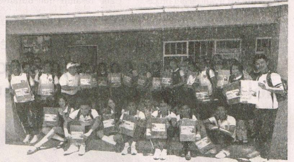
Esta iniciativa la realizan a favor de los jóvenes, con el fin de fortalecer la capacidad intelectual de los estudiantes con estos talleres.

obligados a abandonar una carrera porque no era la que soñaba; por eso con estas capacitaciones de orientación vocacional y profesional, hacemos un trabajo preventivo,