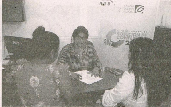
Las personas que están participando en la Conciliación 2019 inscribieron su caso previamente, tal como establecía la estrategia.

Para la realización de esta jornada, el centro ha dispuesto a seis de sus conciliadores en