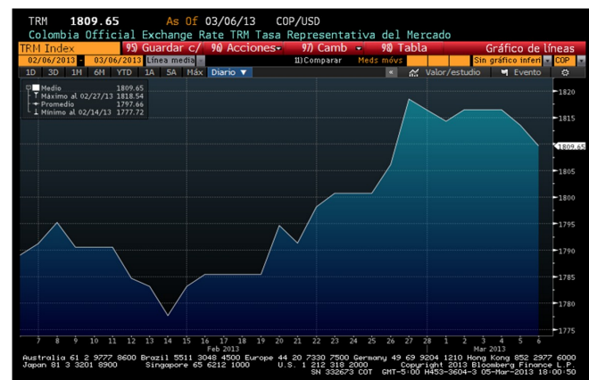
Comportamiento del índice de la Tasa de Cambio Peso/ Dolar del 6 de Febrero al 5 de Marzo de 2013