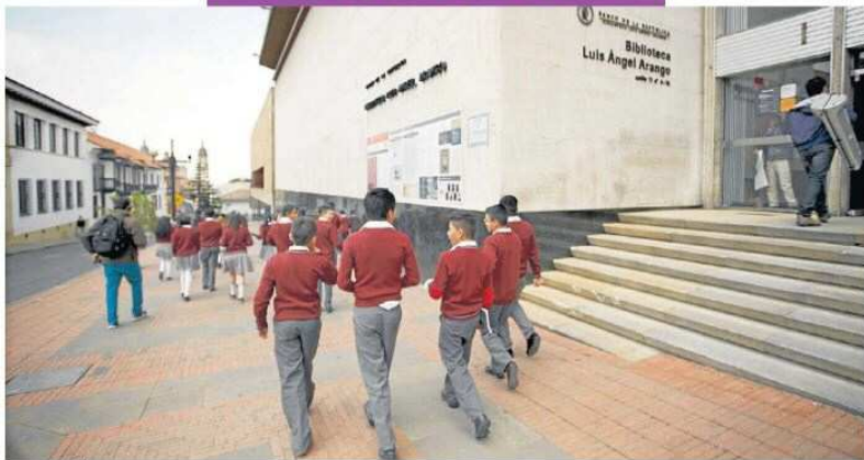
LA PROMOCIÓN DE LA LECTURA y la circulación del libro es una de las apuestas del Ministerio de Cultura.