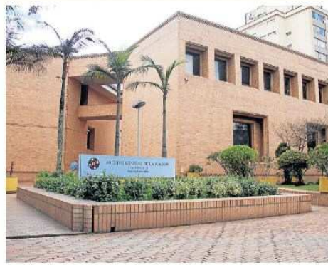
EL CONCURSO RESTAURAMOS Nuestro Patrimonio Documental dio a conocer a los ganadores.

Colprensa Dentro de la celebración de los 150 años de la creación de los archivos nacionales de Colombia, el Archivo General de la Nación organizó esta convocatoria para fomentar en las regiones el interés por proteger y conservar el patrimonio documental. Entidades de Cundinamarca, Valle del Cauca, Antioquia y Casanare, resultaron seleccionadas en el primer concurso 'Restauramos Nuestro Patrimonio Documental', promovido por el AGN con el objetivo de despertar el interés y el reconocimiento del patrimonio documental de las regiones. Se trata de una convo-