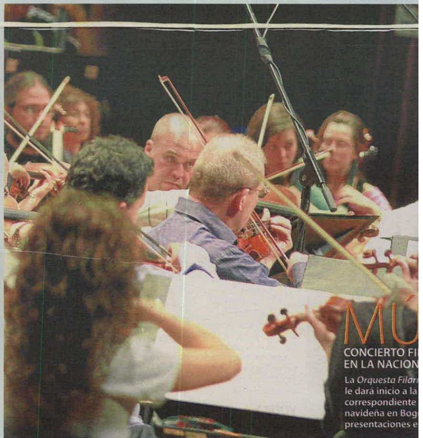
MU CONCIERTO FI EN LA NACION La Orquesta Filar le dará inicio a la correspondiente navideña en Bog presentaciones e

Nitch, un duende de la fábrica de juguetes, anhela gozar del reconocimiento que todos le dan a Santa Claus y por eso destruirá su reputación. Sábado 3:00 p.m. en Focus Teatro . Entrada: desde $17.000.