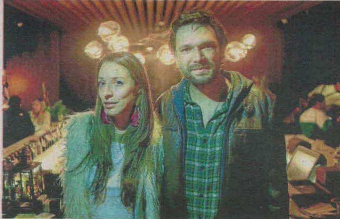
RON LA HECHICERA