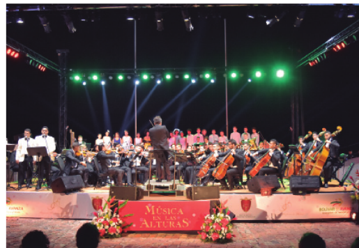
La Orquesta Sinfónica de Bolívar fue exaltada con la Orden al Mérito Cultural del departamento por su aporte a la música y a la cultura del departamento.

Su majestuosidad y calidad artística la han llevado a presentarse en destacados escenarios a nivel regional, nacional e internacional, como la gira "Caribbean Autumn" por siete ciudades de Estados Unidos, el ciclo "A Mi Manera", apreciado por casi 15 mil personas en cuatro municipios de Bolívar; y las presentaciones junto a solistas de renombre internacional como Denis Shapavalov, Francesco Ma-