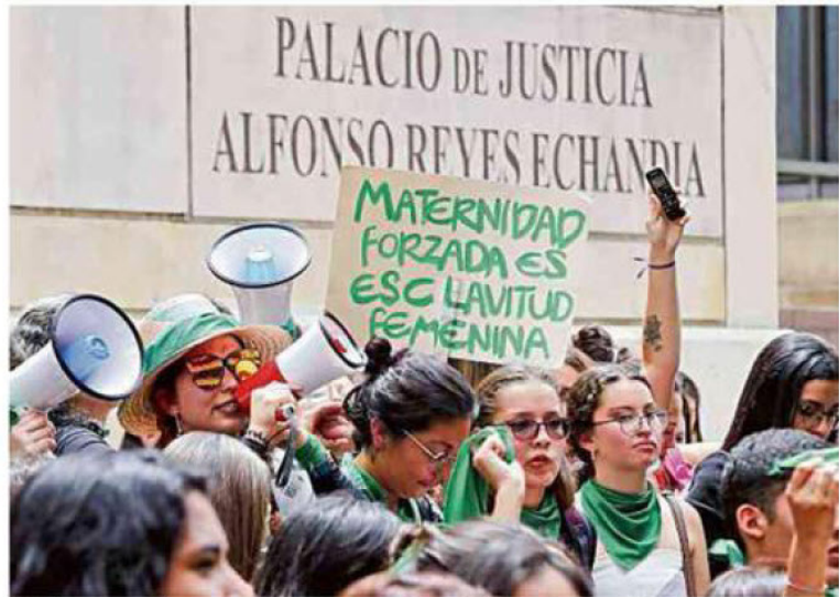
Manifestaciones a favor y en contra de la despenalización del aborto avivan debate.

Él tendrá que decidir si convoca más adelante una audiencia pública, si les da más tiempo a otros organismos para intervenir o si acepta una solicitud que le pide anular todo el proceso. Al final tendrá que elaborar una ponencia que recoja posiciones tan diversas, opiniones que llegaron a la Corte desde diferentes regiones del país y del mundo, hasta este viernes, cuando se acabó el plazo para intervenir. Estas son algunas de ellas.