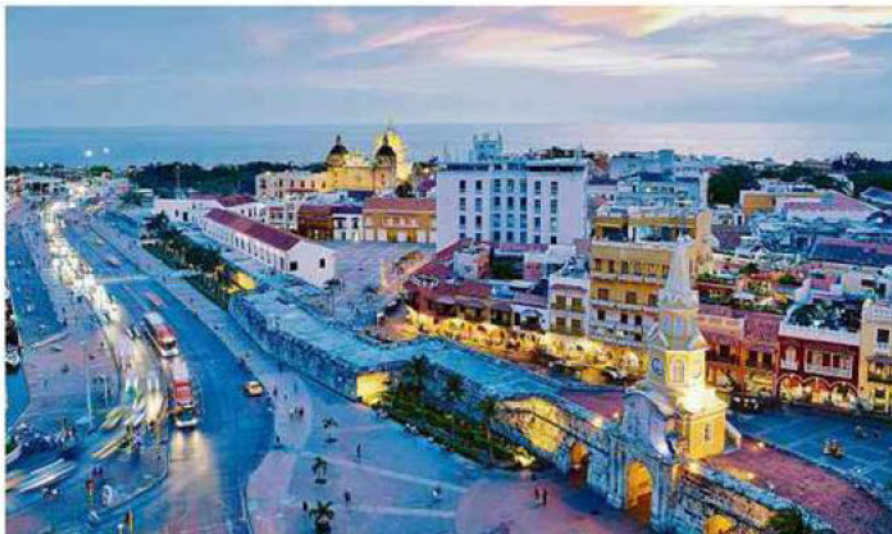
Cartagena y Santa Marta son dos de los destinos con los que se espera jalonar la economía del país.

Así que, es una estrategia urgente darle apoyo a esa industria para volver lo más pronto posible. Cotelco ha hecho lo suyo con el sello de bioseguridad "Juntos contra el Covid", que se otorga a los hoteles que aprueban una