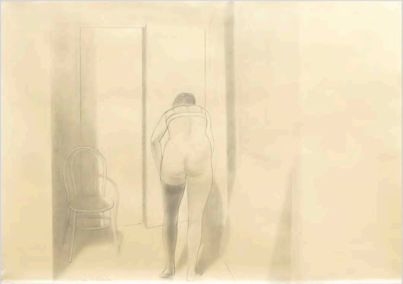
Desnudo en estudio, lápiz sobre papel, 49 x 66 cms, 1970 Portada: Marco de madera, óleo sobre lino, 102 x 93 cm, 1983