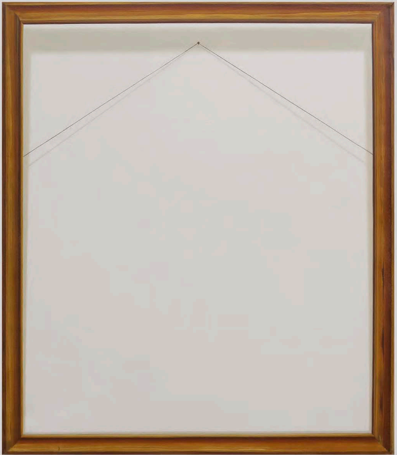
Santiago Cárdenas LO COTIDIANO