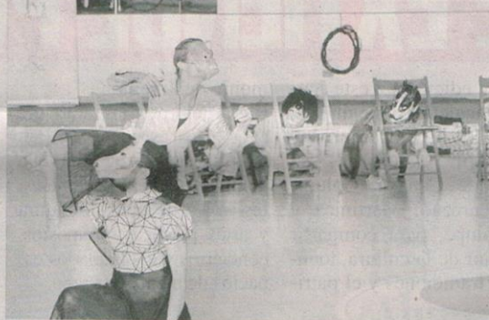
EL Colegio del Cuertpo enseñó danza a 120 bailarines.//#

Como fortalecimiento a los procesos de aprendizaje, creación y circulación de productos artísticos en el sector de la danza, la Alcaldía de Barranquilla y su Secretaría de Cultura, Patrimonio y Turismo, en alianza con la Universidad Jorge Tadeo Lozano seccional Caribe, Promigas y Procaps, trajeron a la ciudad El Colegio del Cuerpo, de Cartagena, una de las compañías de danza contemporánea más reconocidas del país y del Caribe colombiano. Esta visita del Colegio del Cuerpo hace parte del Programa Nacional de Concertación Cultural del Ministerio de Cultura que enseñó a 120 bailarines barranquilleros danza contemporánea, entre los que se destacan los beneficiarios de Casas Distritales de Cultura, programa bandera de la Secretaría de Cultura, Patrimonio y Turismo. El Colegio del Cuerpo demostró que la Región Caribe es pionera en industrias creativas y culturales.