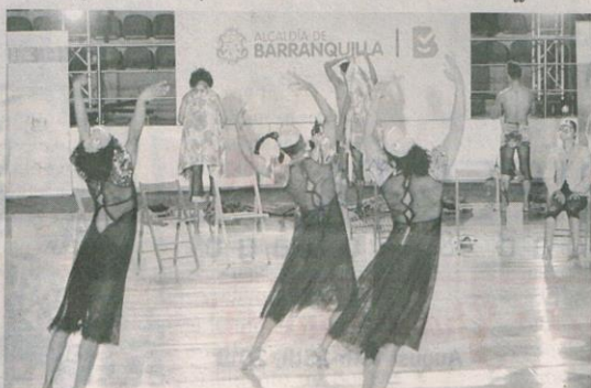
LA Danza Contemporánea, durante su presentación