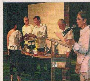
LOS RECTORES DE LA Universidad Complutense de Madrid y la UdeC entregaron los certificados a los estudiantes, junto a un directivo de Utadeo. // KAILINE GIRALDO.

contar con todas estas instituciones en las que se implementarían la jornada única”.