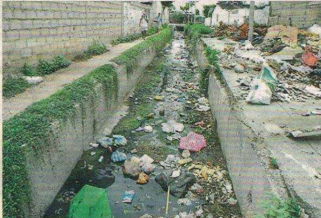
LA MAYORÍA DE CANALES en la ciudad están bastante contaminados, lo que generaría inundaciones en caso de fuertes lluvias.