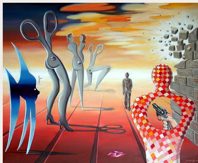
Obra surrealista, artista desconocido

Agregado a lo anterior la explotación de la imagen de la mujer, se ha visto a lo largo de la tradición occidental, evidente desde los griegos y los cánones de belleza, queriendo crear mujeres inalcanzables; Aunque el surrealismo trató de exponer otras partes de lo femenino, se ve a la mujer como un objeto consumible.