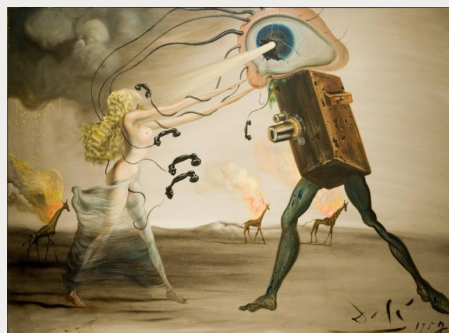
Artista: Salvador Dalí

estas artistas abrieron nuevas vías para la exploración de la imaginación y el subconsciente en el arte, innovaron en el siglo XX al explorar temas y técnicas que no eran comunes en la época como por ejemplo el uso de materiales poco comunes para fines artísticos, una artista que hizo esto es Meret Oppenheim, es conocida por su obra “El objeto surrealista” (1936), una escultura que consiste en una taza, un platillo y una cuchara cubiertos con piel de animal. Oppenheim se destacó por su uso de materiales inusuales y su enfoque en el surrealismo como una forma de explorar la sexualidad y el feminismo. Y es que el diseño industrial busca la exploración de nuevas formas y materiales que puedan mejorar la funcionalidad y la estética de los productos y al mismo tiempo el surrealismo se caracterizó por la exploración de formas y materiales poco convencionales.