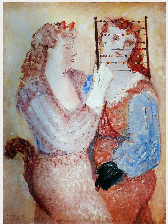
Girl-Friend - Artista: Leonor Fini