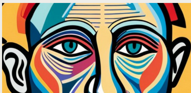
Imágenes sacadas mediante Inteligencia Artificial

Adicional, se usó también como un nuevo medio de experimentación de técnicas de arte, sin embargo, otros si lo usaron como su medio de expresión masivo o impactante de su autoconcepto. Pero esta sin duda fue uno de los aportes con mayor impacto para conocer a los artistas de muchas obras de épocas pasadas, donde no hubo muchas herramientas como las hay en la actualidad,