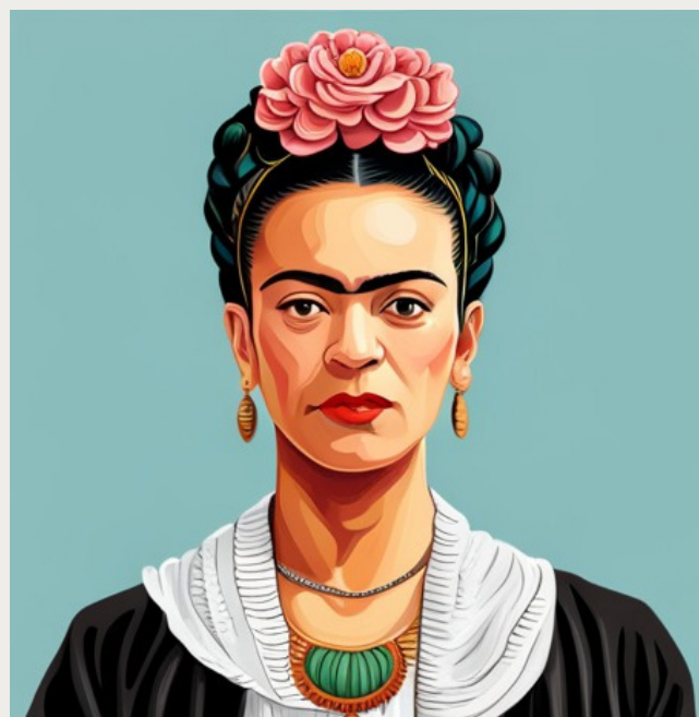
Imágenes sacadas mediante Inteligencia Artificial

En el siglo XX el autorretrato fue un gran impacto para el mundo del arte, por lo cual esta expresión fue una forma de arte popular y muy significativa, ya que varios artistas los usaron como un medio para la representación de su identidad y expresión de sí mismos como lo fueron Pablo Picasso, Frida Kahlo, entre otros , no obstante, los mismos artistas le dieron un cambio a la creación y presentación de los autorretratos de la época significativamente, como consecuencia de la llegada de nuevas tecnologías y técnicas artísticas.